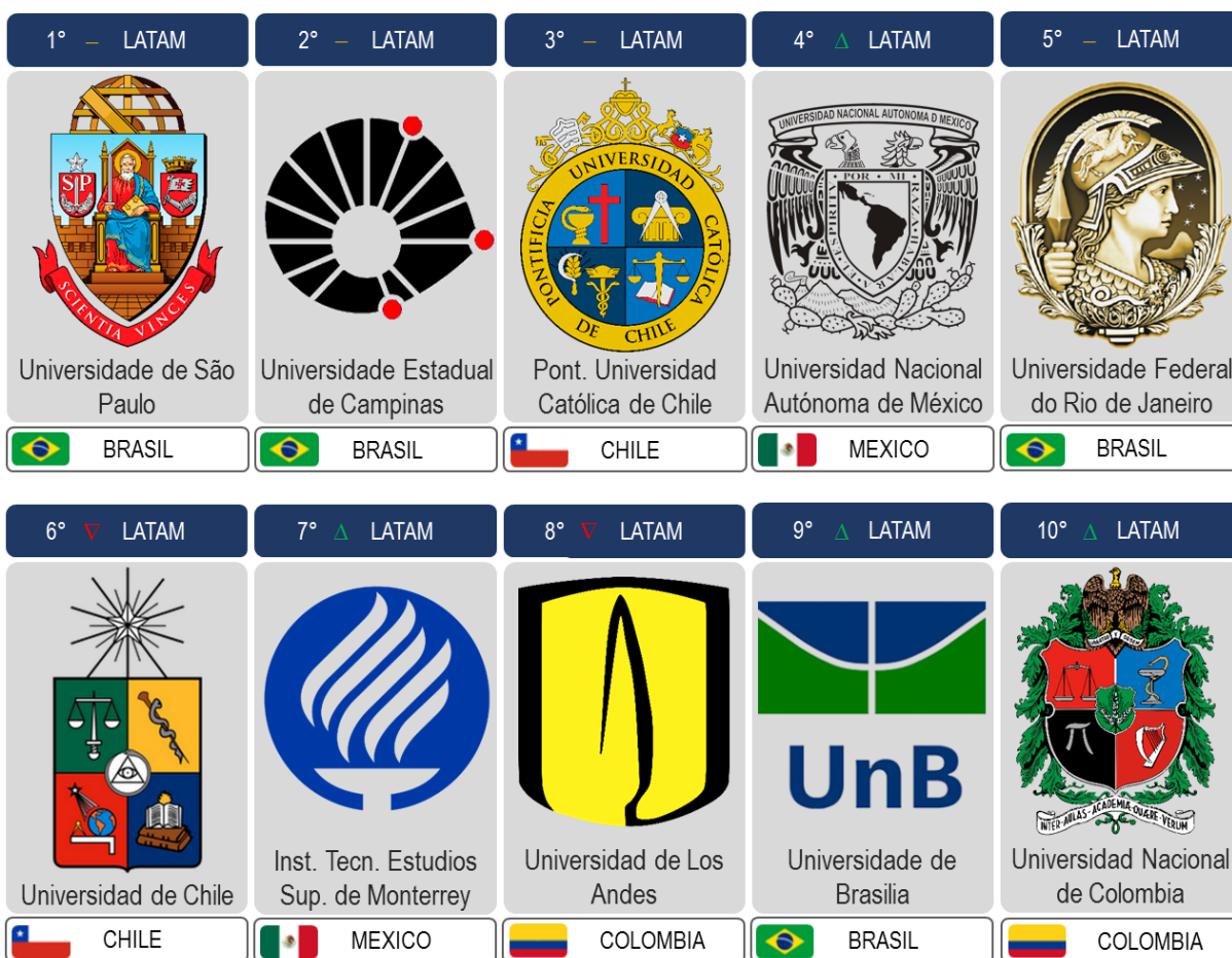
Diagrama 1: Clasificación QS University Rankings: Latin America 2016

El QS University Rankings: Latin America, enseña un listado de universidades ubicadas en la región clasificadas mediante la metodología explicada en la sección anterior. A continuación, en el diagrama 1 se presentan las primeras 10 universidades con mejor puntuación de Latinoamérica según QS: