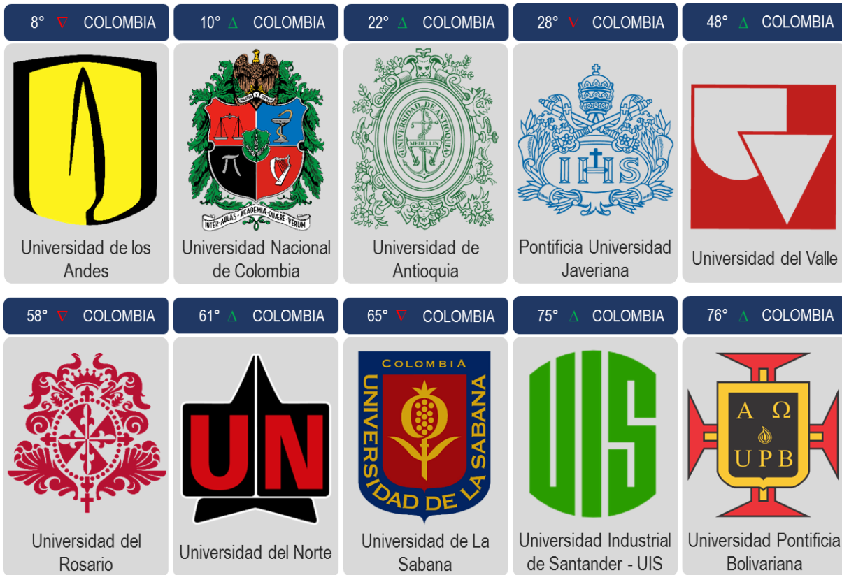
Diagrama 2: Clasificación QS University Rankings: Latin America | Colombia 2016

La Universidad de Los Andes , primera en Colombia se ubica en el puesto 8; seguidamente en el puesto 10 y segunda en Colombia la Universidad Nacional de Colombia .