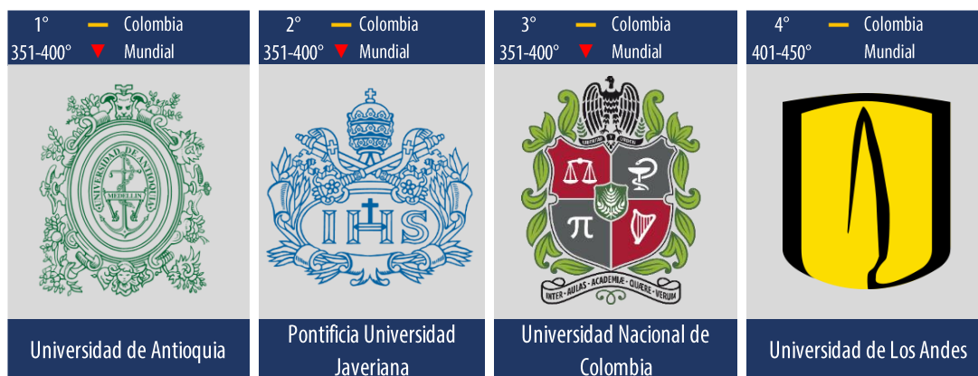
Diagrama 6: Posiciones de las mejores universidades en Colombia que ofrecen carreras relacionadas con el área de conocimiento “Medicina”.

Entre las mejores 400 universidades del mundo , La Pontificia Universidad Javeriana logra clasificarse en el área de conocimiento de Medicina , con 53.0 puntos promedio, alcanzó la puntuación necesaria para ser clasificada entre las mejores 400 universidades a nivel mundial (QS clasifica las mejores 500 universidades). Para Colombia, en el primer lugar para ésta área se ubica la Universidad de Antioquia con 54.8 puntos promedio alcanzados, en el segundo lugar la Pontificia Universidad Javeriana , en el tercer lugar se observa a la Universidad Nacional de Colombia con 52.6 puntos promedio y en el cuarto lugar la Universidad de los Andes con 48.0 puntos promedio. La Universidad de Antioquia , la Universidad Javeriana y la Universidad Nacional de Colombia bajaron el rango de posición de 301-350 en la edición de QS2016 al rango 351-400 en la edición de QS2017 (ver diagrama 6).