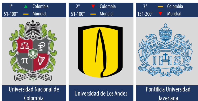
Diagrama 4: Posiciones de las mejores universidades en Colombia que ofrecen carreras relacionadas con el área de conocimiento “Lenguas Modernas”.