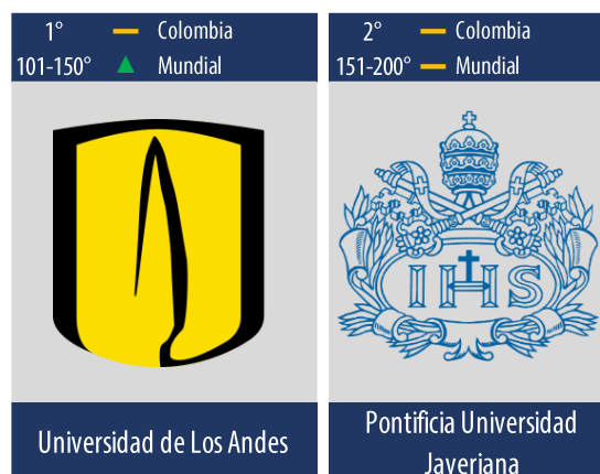
Diagrama 2: Posiciones de las mejores universidades en Colombia que ofrecen carreras relacionadas con el área de conocimiento “Filosofía”.