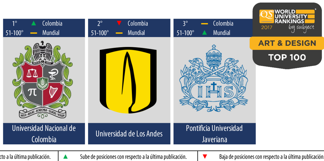
Diagrama 1: Posiciones de las mejores universidades en Colombia que ofrecen carreras relacionadas con el área de conocimiento “Arte & Diseño”.

Entre las mejores 200 universidades del mundo , la Pontificia Universidad Javeriana logra clasificar sus carreras a fin con las siguientes áreas de conocimiento: