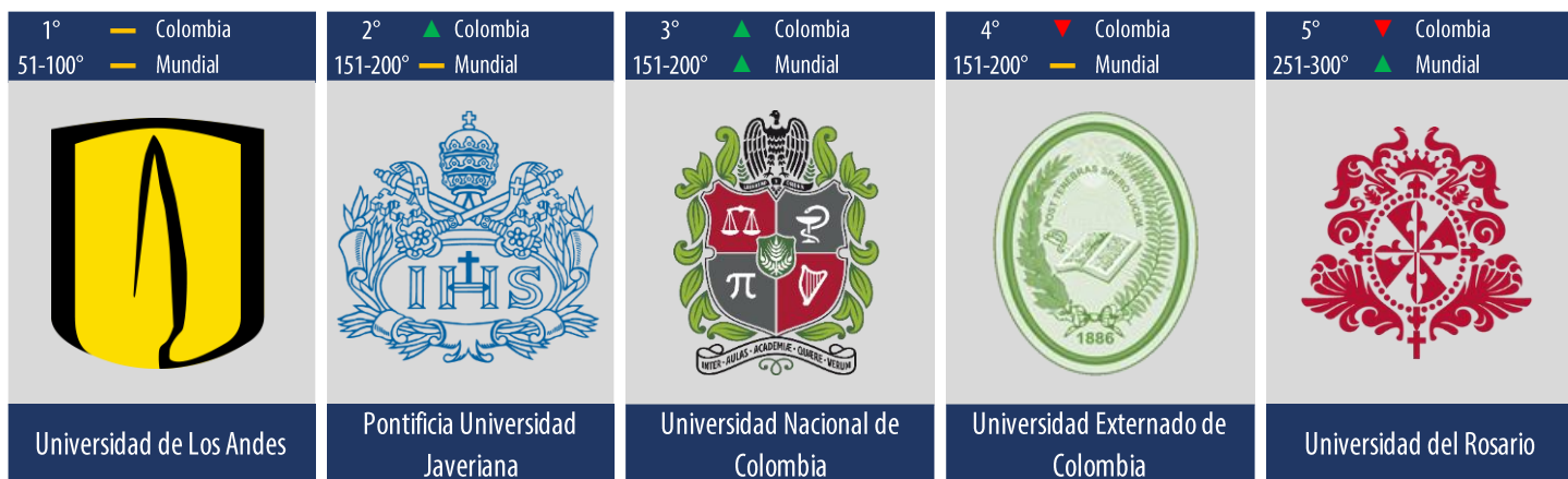
Diagrama 3: Posiciones de las mejores universidades en Colombia que ofrecen carreras relacionadas con el área de conocimiento “Leyes”.