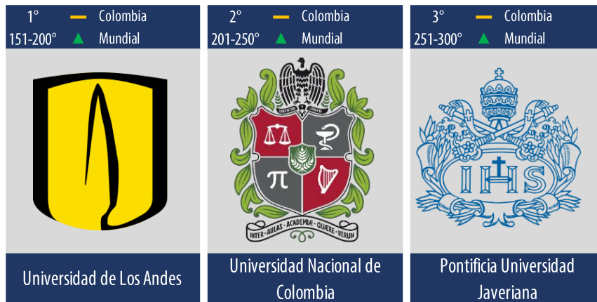
Diagrama 5: Posiciones de las mejores universidades en Colombia que ofrecen carreras relacionadas con el área de conocimiento “Sociología”.

En Colombia, la mejor institución ubicada para ésta área temática es la Universidad de Los Andes con 60.4 puntos promedio y la Universidad Nacional es segunda con 60.1 puntos (ver diagrama 5).